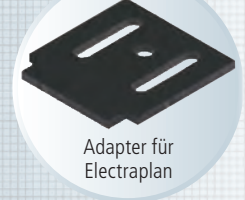
Adapter für Electraplan